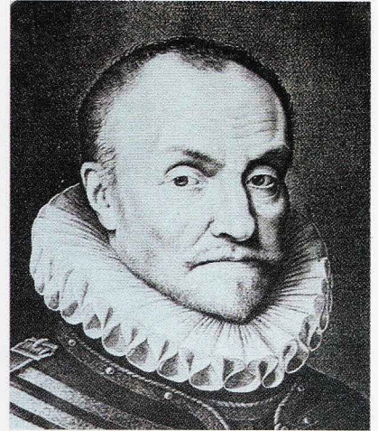
Willem de Zwijger, vader des vaderlands.

'WILHELMUS VAN NASSOUWE BEN IK VAN DUITSEN BLOED...' DE STAMVADER VAN ONZE ORANJES KWAM UIT DUITSLAND, EN DAARNA STROOMDE ER NOG VEEL MEER DUTS BLOED IN ONS KONINGSHUIS. VEEL PLAATSEN IN DUITSLAND HEBBEN 'IETS' MET DE ORANJES. WE KIEZEN DE MOOISTE UIT VOOR EEN KAMPEERREIS MET EEN ORANJE TINTJE.